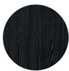
Fresno negro Black Ash